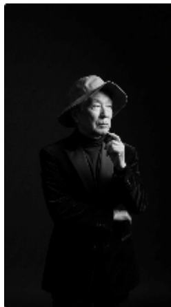
ドラマティックなモノクロ